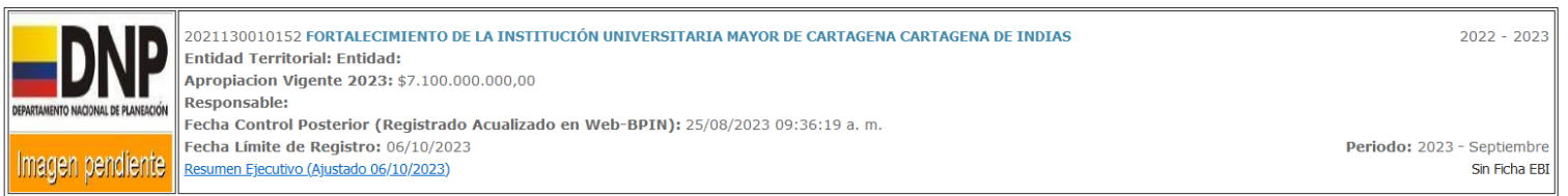
Imagen Cargar Resumen Ejecutivo (Actualizar Borrar)